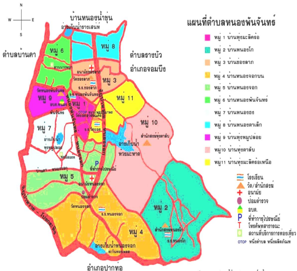
แผนที่ตำบลหนองพันจันทร์